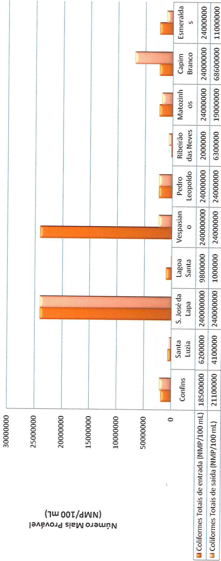
Gráfico 3 – Análise das Amostras – Coliformes Totais – Efluente de Entrada x Saída